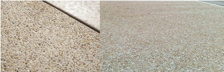
PAVIMENTAZIONI IN CALCESTRUZZO CON EFFETTO "GHIAIA A VISTA"