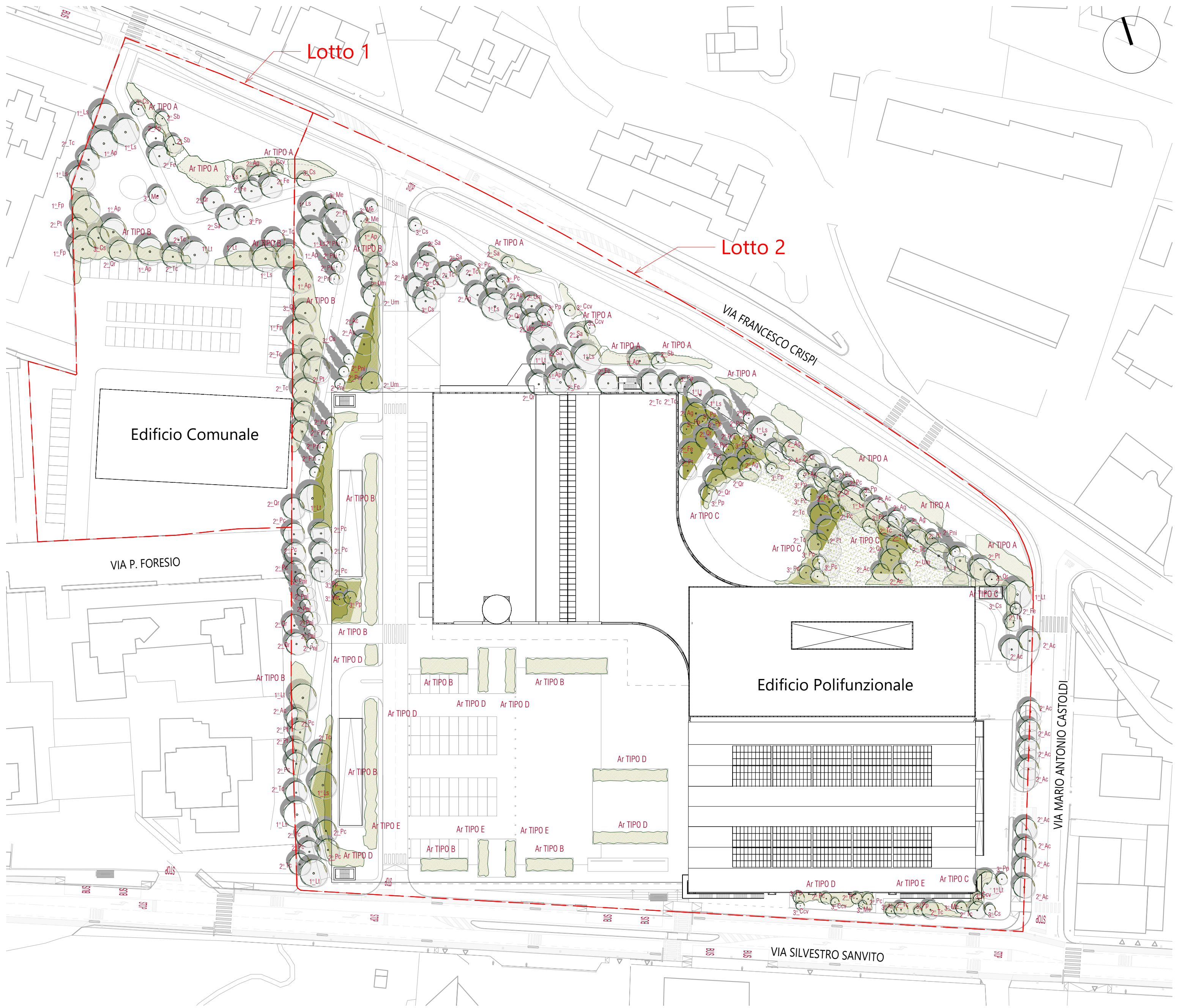
Progetto del Verde Diagramma delle Essenze 1 : 750