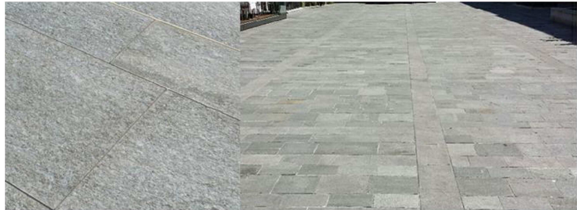
PAVIMENTAZION IN PIETRA LUSERNA