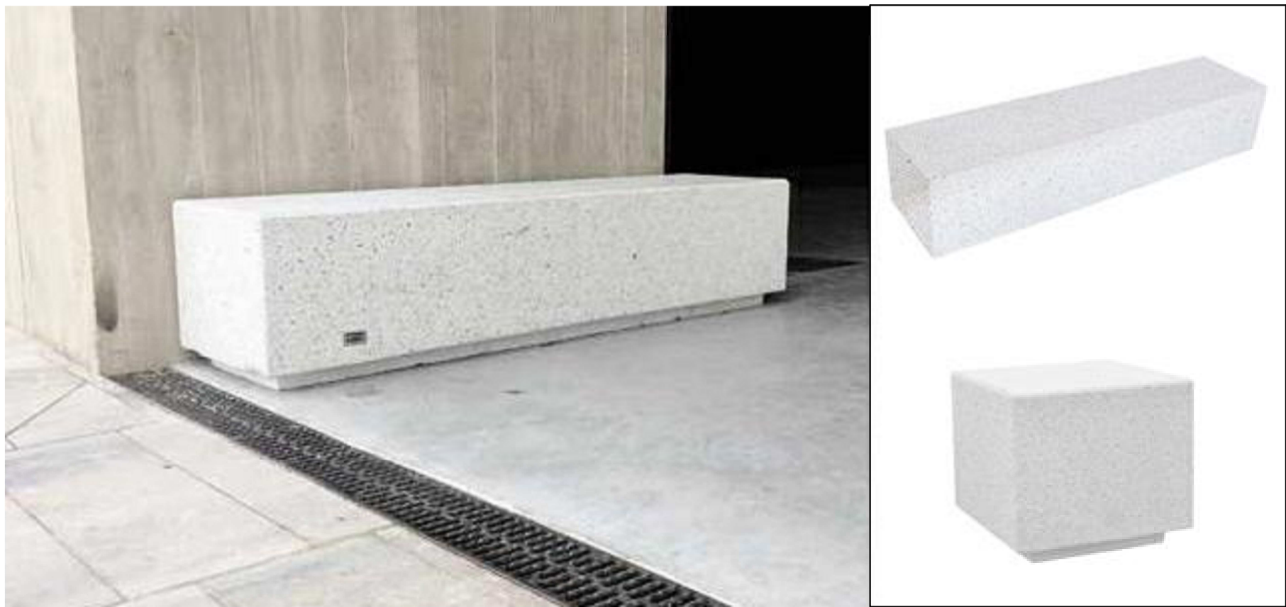
ARREDO URBANO - SEDUTE IN CALCESTRUZZO ARCHITETTONICO